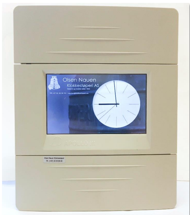
Bilde 1: APOLLO 3 i hvileskjerm-modus

Standard Kirkeprogram, Ringeautomatikk, Versjon 2017/11/24